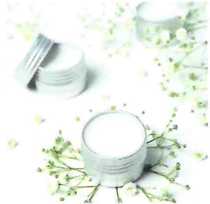
ฝึกปฏิบัติการทำ balm ฝึกการผสมกลิ่นใน balm