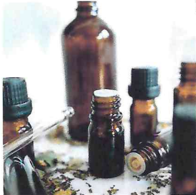
เรียนรู้เกี่ยวกับสูตรนำวัตถุดิบ การเลือกกลิ่น และผสมกลิ่น